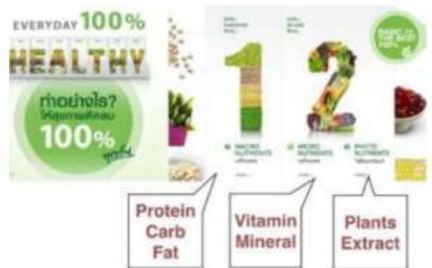
SNSを通じた情報発信