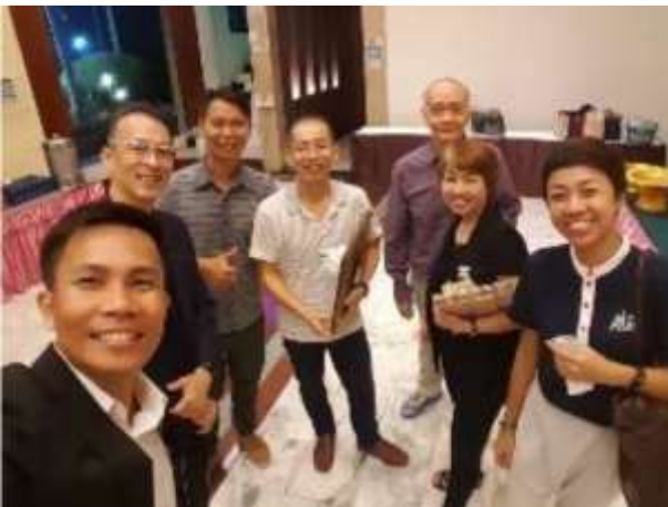
計画に参加したメンバー