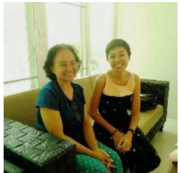
フォローアップでの家庭訪問の様子