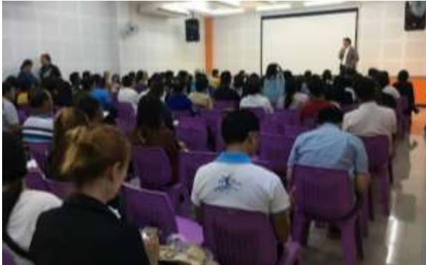
医師による健康に関する講義の様子

講義テーマは栄養、快適な睡眠、適度な運動、健康的な心理状態などであり、高齢者と家族は家庭における健康管理についてさらなる知識を得た。また、ボランティアや地域社会の一員として、家庭における高齢者の健康管理に参加することへの意欲を高めた。