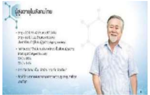
作成したページの例

健康に関する知識を普及、定着させるために、ボランティアの協力のもと、Facebook、LINE、ブログといったメディアのデザインと制作を行った。