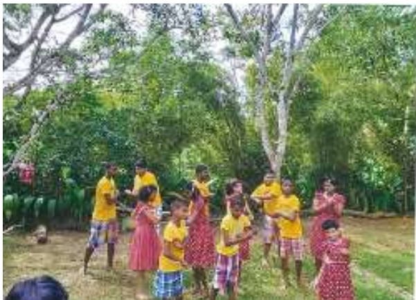
ダンス活動の様子

この他にも、ダンス活動を取り入れ、心身の発達やソーシャルスキルの習得を促す活動を展開した。上手に、楽しそうに踊る子どもたちの姿は、家族にとっても誇らしい姿であったろう。