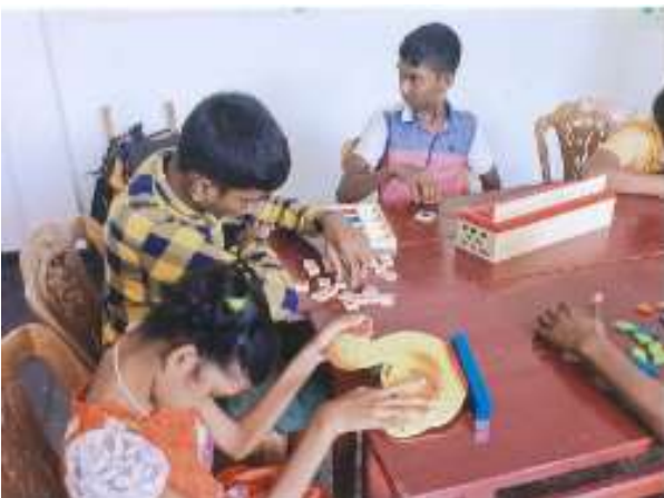
知育玩具で遊ぶ子どもたち

子どもたちは、知育玩具で遊ぶことを通じて、考えること、表現すること、そして友人とのコミュニケーションを学ぶことができた。