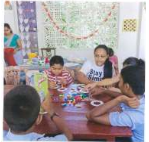
一緒に遊びながら子どもたちは社会性を身につける