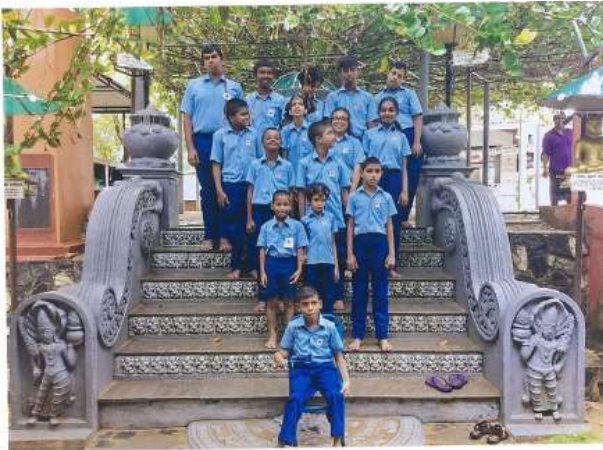
活動に参加した子どもたち

地域に住む知的障害のある15名の子どもたちを対象にデイ・ケア・センターを開設した。なお、スタッフとして3名が参加した。