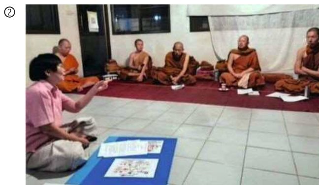
僧侶を対象とした健康的な食事についての研修