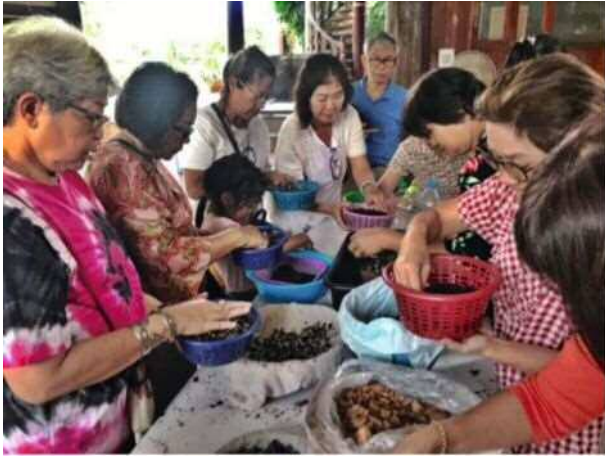
緑のワークショップでひまわりの苗を栽培