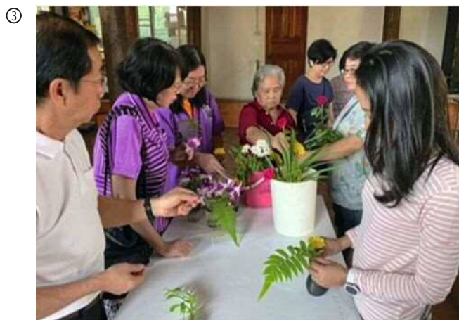
MOA タイ財団によるフラワーアレンジメント