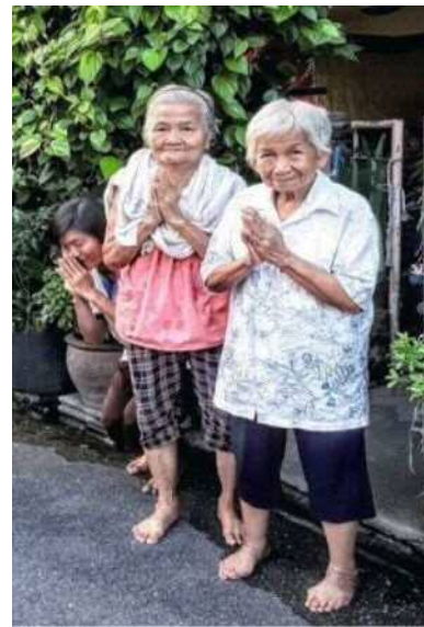
家庭訪問の際の参加者たち