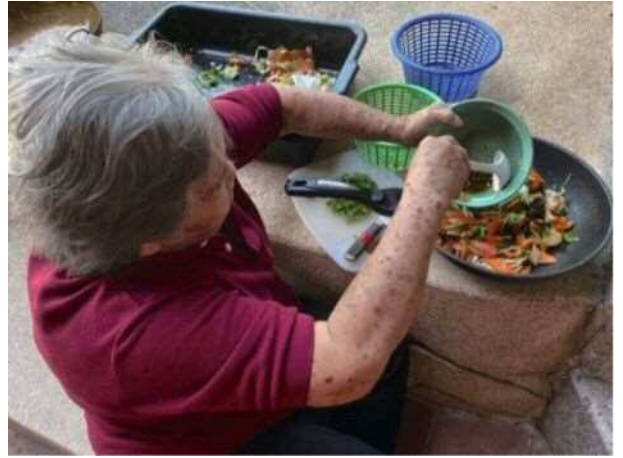
ひまわりを使った料理教室