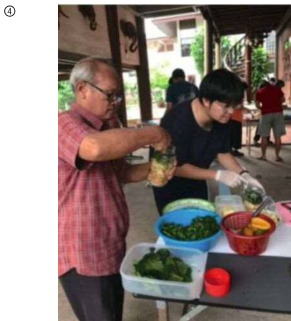
緑のワークショップで桑の葉から醤油を作る