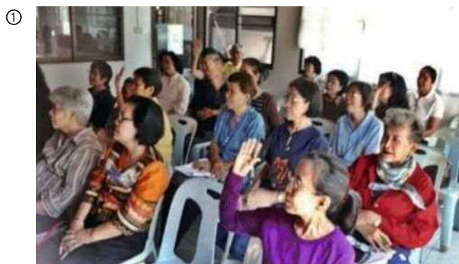
健康的な食事の基本の学習