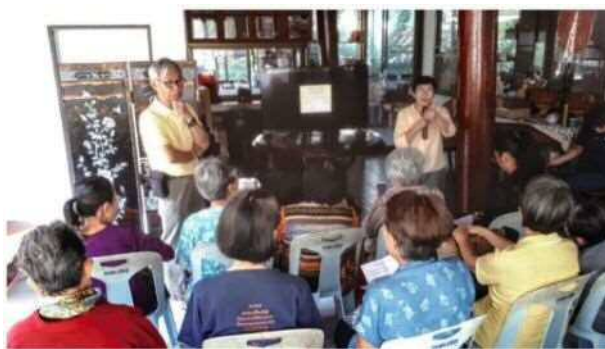
振り返りでのミーティング