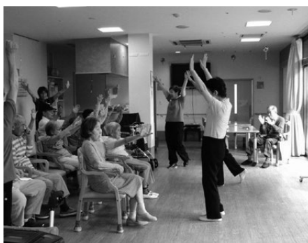
施設での歌体操のようす

健康寿命とは他人の手を借りないで生活できる年であり、平均寿命とは死亡する年齢であるから、その11年は健康保険や介護保険のお世話になり、病院や介護施設で生活することになります。この健康寿命を少しでも伸ばすことが、歌体操を行うことで達成できるとしたら、この活動をしてきた甲斐があるということだと思います。その道へ進みたいと思っています。