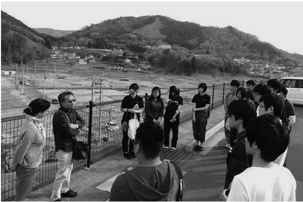
ミーティングを行うFWSとKWRの皆さん

長することができました。まだ実感はないが、いつかこの時のことが役に立つ時がくると信じています。また機会があれば東北へは足を運びたい。