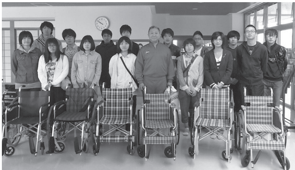
気仙沼市 燦さん館デイサービスセンターにて

使われなくなった中古車いすを修理して、海外の人たちにプレゼントをする活動を続けている「空飛ぶ車いす学校グループ（28都道府県81校）。東日本大震災の後は被災地の車いす支援にも乗りだし、東北3県に4百台を超える車いすを贈ってきました。震災から既に3年、今回は5月4日〜6日のゴールデンウィークに女川町社会福祉協議会、大船渡市気仙苑、気仙沼市燦さん館デイサービスセンター、福寿荘デイサービスセンターを訪れた神奈川工科大学、新潟医療福祉大学の学生たちのレポートをお届けします。