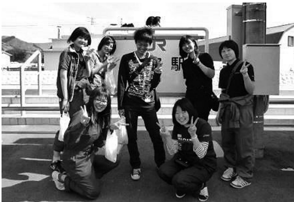
FWSのメンバー・男子高校生も参加