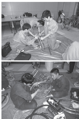
作業に励む岩手の高校生

今年スタート時間が早かったにも関わらず県下7校から引率の先生と共に約30名の高校生