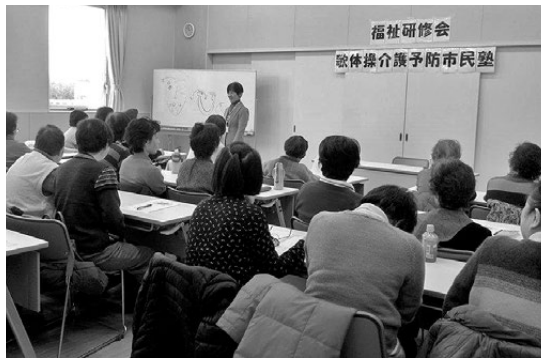
集合研修会のようす

団体の活動目的は、高齢者施設における認知症者を対象に、歌体操を媒体として交流する事によって明るく元気な姿を少しでも取り戻せる事を狙いとして、最終的には、笑顔が出ること