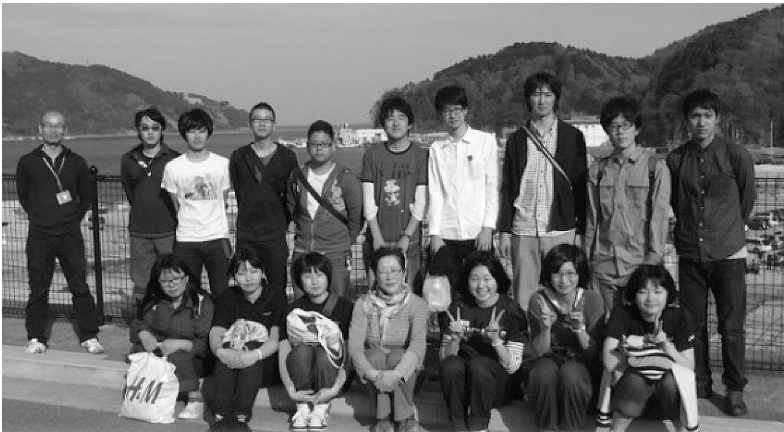
FWSとKWRの皆さん 女川町社協地域センターにて

私は福島県出身で、津波の被害は受けなかったものの、震度6弱もの大きい地震を経験しました。生まれて初めて経験した大地震、激しい揺れとミシミシとなる家、落ちてくる者に何が起っているのかすぐには判りませんでした。ただ必死の想いで家の外に逃げました。あれから3年がたち大学生になりました。そんな時にこのプロジェクトに誘っていただきました。不安は大きかったのですが、積極的に行動し学べることが全て学ぶということを目指し東北の復興に少しでも力になれるという気持ちで東北に向かいました。この3日間で沢山の人の出会い、沢山のお話を伺い、自分も成長することができたと思います。このプロジェクトに