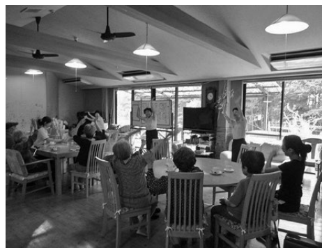
施設での歌体操のようす

日社済の助成金により、指導者を確保し会場を確保して、研修会ができたことは、幸せでありました。今後も、是非日社済の支援を受けて、高齢者の味方である歌体操を充実させていきたいと考えています。