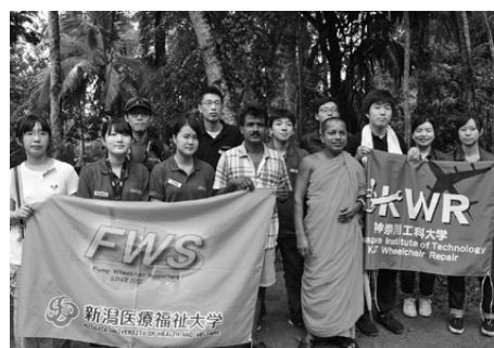
家庭訪問はお坊さんが案内してくれた