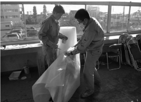
車いすの梱包作業