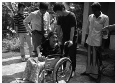
スリランカに届いた車いす