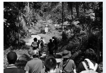
田舎道を歩いて家庭訪問へ