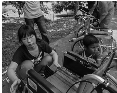
修理中の私と少年

一緒に修理をしたのは小学生くらいの少年でしたが、ジェスチャーなどで示せば、車いすを抑えてくれたり、自分から進んで車いすを運んでくれたりして、とても助かりました。上手く会話ができて、彼に感謝の気持ちが伝わったのか、少し疑問です。