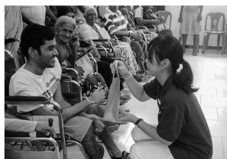
贈呈式に参加してくれた11人には日本のお菓子もお渡しした