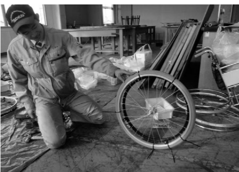
ノーパンクタイヤへの交換完了