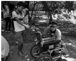
養護施設の子もたちも興味深そうに手伝ってくれた