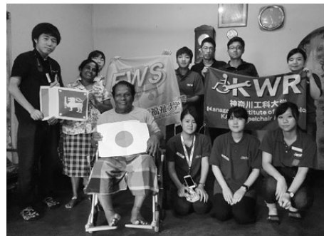
手製のいざり車で暮らしていたが、奥さんも車いすは大助かりと喜んでくれた