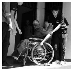
車いすで段差をクリアする方法を実演