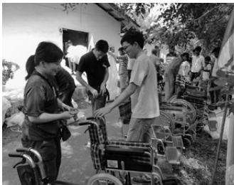
スリランカの学生と共同で整備した車いすの最終点検

最後に今回の活動状況報告について、初めて海外活動を行った2名の大学生のレポートをお届けいたします。