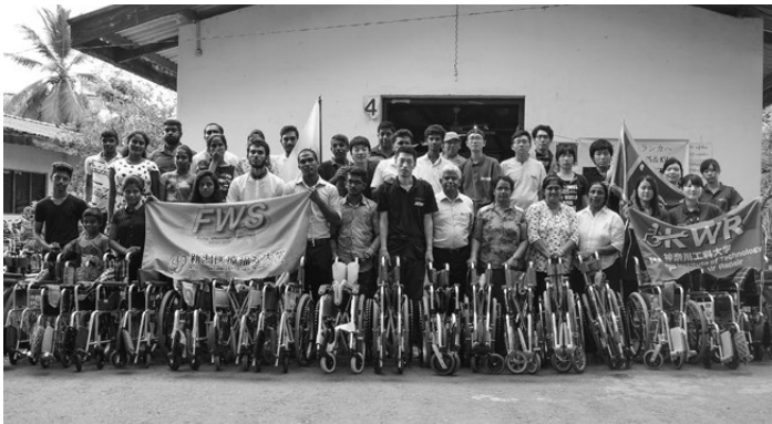
修理完了の記念撮影