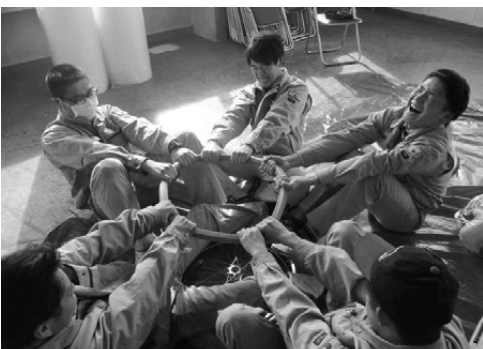
共同作業の一コマ