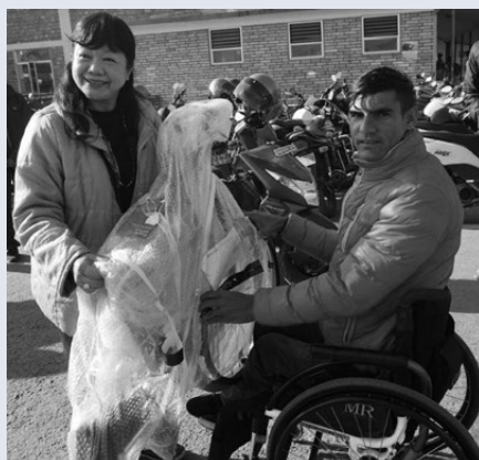
バラツさんにプレゼント