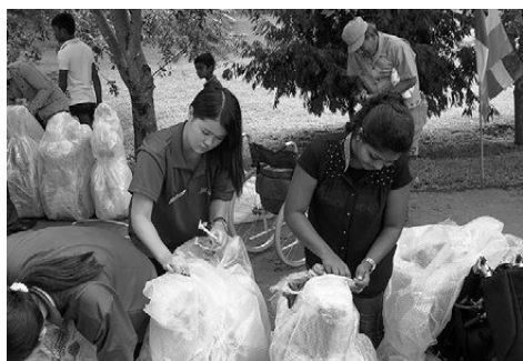
スリランカの学生たちと一緒に梱包を解く

うに動かせない人の方が足を切断してしまっている人よりも多いと思います。それは日本の義足技術が発展しているからなのでしょうが、国が違うと使用する人も、また使用する人の障害の状態も違ってくるということに衝撃を受けた家庭訪問でした。