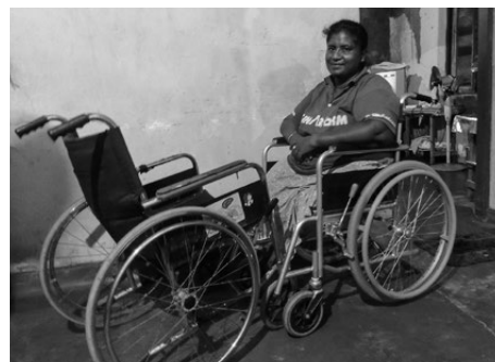
5年前、秋田からもらった車いすは、タイヤは摩耗しブレーキも壊れた。1人暮らしに2台目は必需品だった