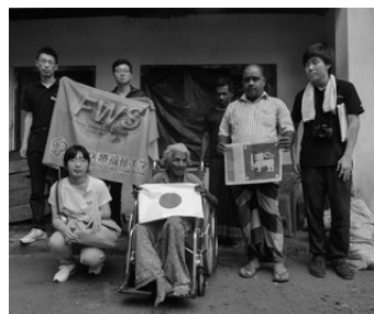
歩けない一人暮らしのおばあさんは隣のお世話で暮らしている