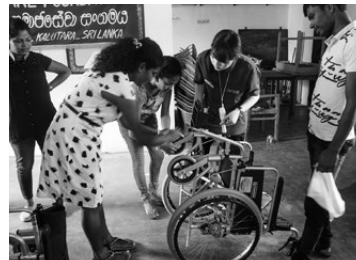
スリランカの子学生も手際よく修理してくれた