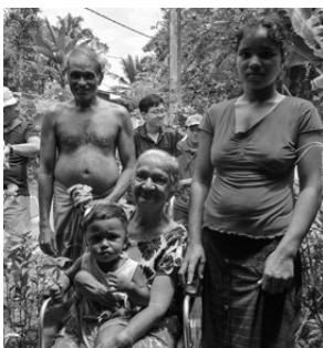
孫を抱っこして喜ぶ一家