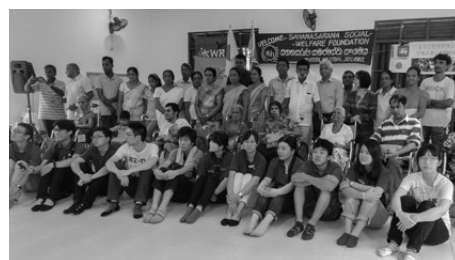
今回も活動を支えてくれたサハナサラナ財団のボランティアと記念撮影