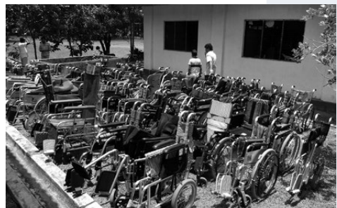
スリランカの学生の手伝いで整備完了した車いす